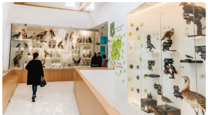
A Madárország kiállítással szeretnénk megnyerni a látogatókat a természet-és madárvédelem ügyének

A látogatóközpont létrehozásával minden tekintetben komoly értékmentés valósult meg, hiszen újjáéledt egy romjaiban is értéket képviselő villaépület, a hazai biedermeier megalkotójának, Steindl Ferencnek az egykori villaépülete. Emellett értékmentés valósult meg abban a tekintetben is, hogy az egykori Madártani Intézetből megörökölt, több száz példányt számláló, kultúr- és tudománytörténelmi szempontból is egyedülálló madárpreparátum-gyűjtemény végre méltó helyszínen kerülhet bemutatásra.