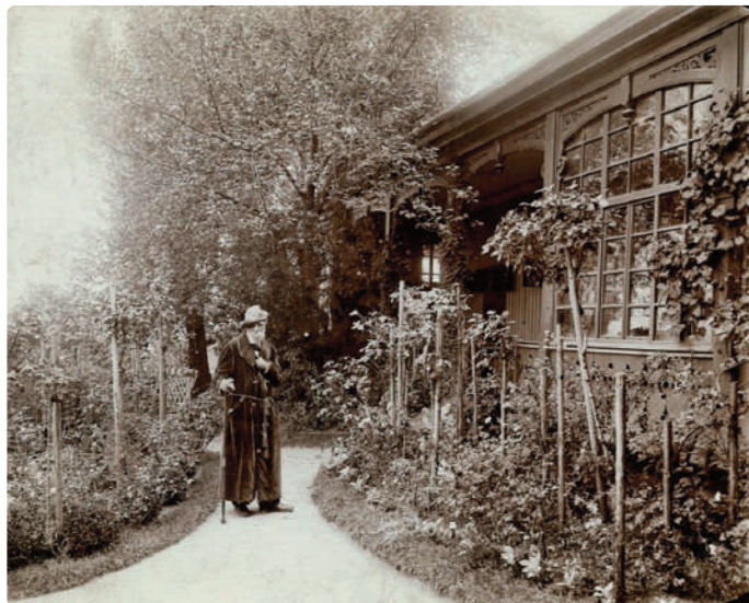
Jókai a rózsái között a svábhegyi villa előkertjében

Talán nem túlzás azt állítani, hogy sem Jókai előtt, sem utána nem volt magyar író, aki úgy ismerte volna a természetet, a virágokat, a füveket, a fákat és egyéb növényeket, mint ő. Egyetlen regénye vagy elbeszélése sincs, amely ne bővelkedne állat- és növényfajokban, vagy épp ásványokban. A botanikus Moesz Gusztáv 600 növényfajt mutatott ki művei jelentősebb részéből.