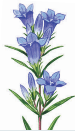
Fülemülesitkék elengedés előtt