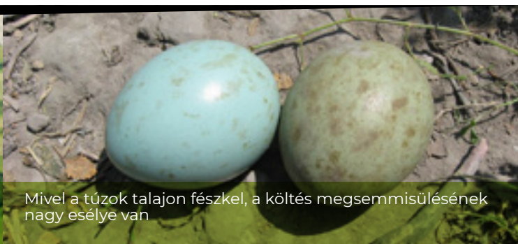
Mivel a túzok talajon fészkel, a költés megsemmisülésének nagy esélye van

A kaszálás térbeli menete az élővilág szempontjából kiemelkedő fontosságú. Az állatok menekülését biztosító ún.