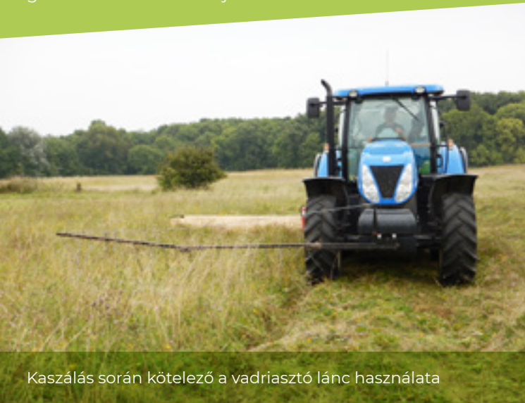
Kaszálás során kötelező a vadriasztó lánc használata

A Natura 2000 az Európai Unió ökológiai hálózata, melyhez hazánk 2004-ben csatlakozott és kijelölte a Natura 2000 területeket. A hálózat célja, hogy biztosítsa az EU területén ritka és veszélyeztetett élőhelyek, valamint növény- és állatfajok fennmaradását. A kijelölt területek jelentős része gyepterület, ahol a közösségi jelentőségű élőhelyek és fajok védelmének túl a fenntartó és értékőrző gazdálkodást is biztosítja.